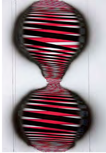
Fibres of time - 2009