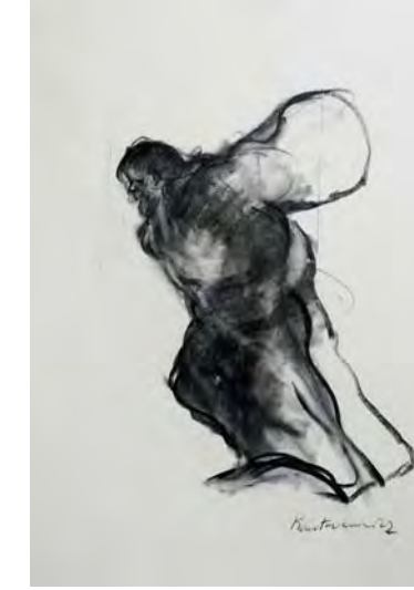
La reine mère - 2003