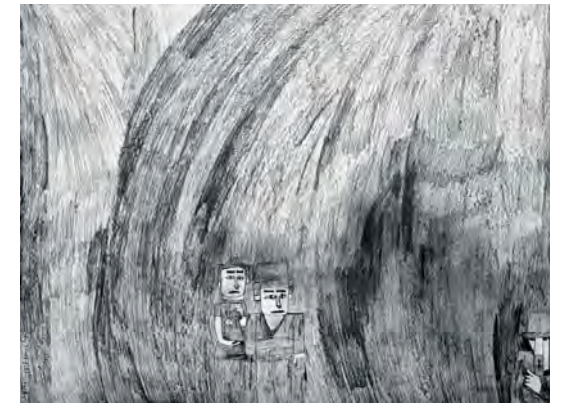
Sans titre - 2005

De nature anxieuse, le moindre changement dans son quotidien le perturbe et le pousse à des gestes incontrôlables. Pour travailler à l'atelier, il a absolument besoin d'un support visuel qui le rassure et qu'il copie à l'infini. Ses références favorites sont "Le déjeuner sur l'herbe" et "L'Olympia" de Manet, "Le Christ jaune" de Gauguin... (CB).