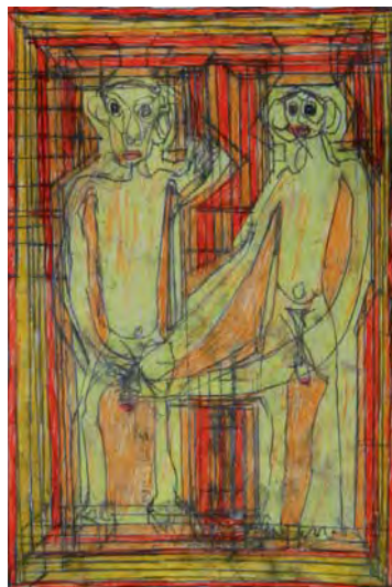
Sans titre - 2007