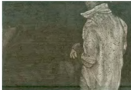
Melancholia Stigmata - 2008

Le plus jeune artiste de l'exposition s'exerce, expérimente, passant d'un thème à un autre, d'une technique à une autre avec rigueur, toujours sensible à l'image cinématographique. (SLM).